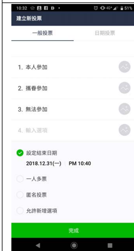
4. 投票內容限制選項