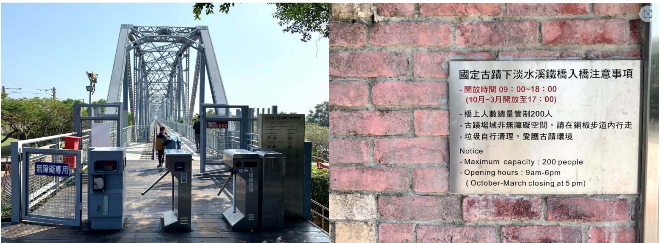
圖三 進入園區有時段限制