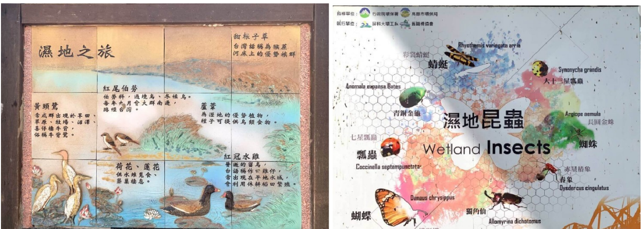
圖四 舊鐵橋濕地教育內常見動物