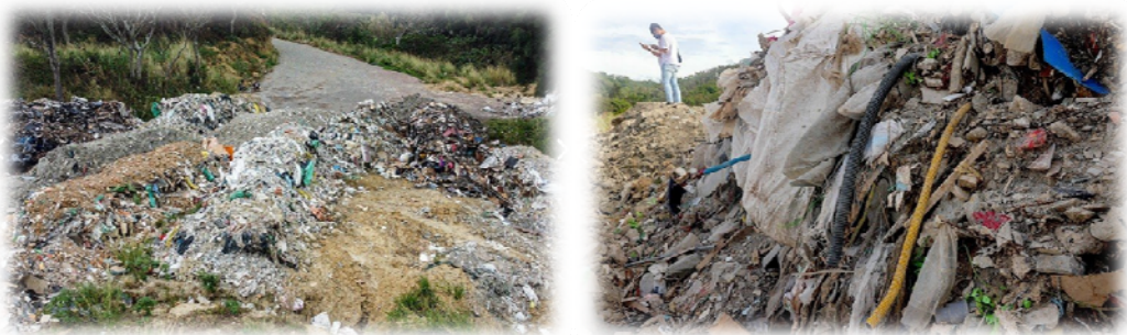
苗栗縣後龍鎮龍港段某山坡地遭不法業者亂倒營建廢棄物

聯合報報導「國在山河廢」(詳參考資料 4)，台灣從北到南濫倒案例遍地開花，歷歷在目真是令人罄竹難書，心情久久難以平復！