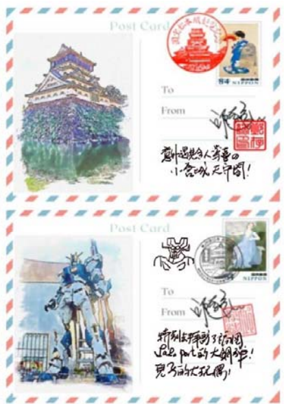
圖三 旅行繪畫明信片之分享