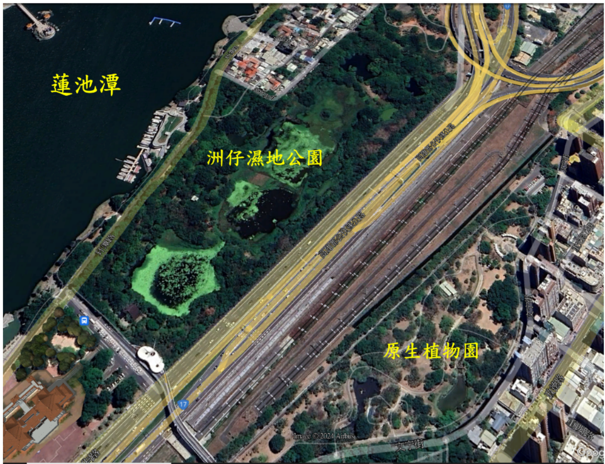
圖二 洲仔濕地公園公園地圖

「洲仔濕地公園」位於高雄市左營區蓮池潭畔洲仔路間，原是一片水田窪地，多年前在此有眾多「水雉」聚集。然而因都市開發，而遷徙至台南的官田一帶，為了使美麗的水雉重返高雄，台灣溼地保護聯盟等團體推動「水雉返鄉計劃」，向市府爭取還原土地原貌而設立濕地公園，獲得高市府工務局認同，以生態工法共同打造出一座濕地公園，以回歸都市荒野和生態棲地，建構一座具有菱角、蓮花、水雉、小水鴨等浮葉植物與動物共生共存的淡水埤塘生態體系。