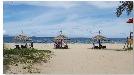
會安五星新世界飯店