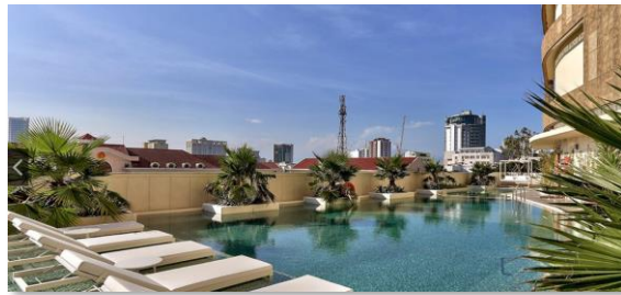
峴港希爾頓飯店附設泳池