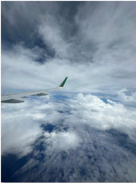
乘風遨遊雲端之上

隨著肆虐全球長達3年多的肺炎疫情終於結束畫下句點，公司停辦多年的海外旅遊也終於決定恢復在下半年辦理，同仁們獲知後也都翹首期盼旅遊活動能早日到來，可以再次搭乘飛機遨遊天際、俯瞰大地，期盼享受公司精心安排的五星級酒店及知名旅遊勝地景點，希望這趟能夠和同事們一起吃好、喝好、玩好，以及在他鄉異國逛街購物趣的難忘之旅！