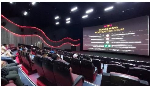
欣賞 4D 電影