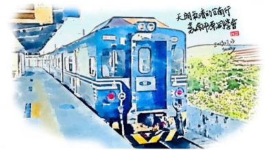
圖 TPCEDM896 手機快速旅繪及 LINE 發送明信片流程